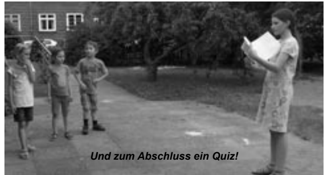
Und zum Abschluss ein Quiz!