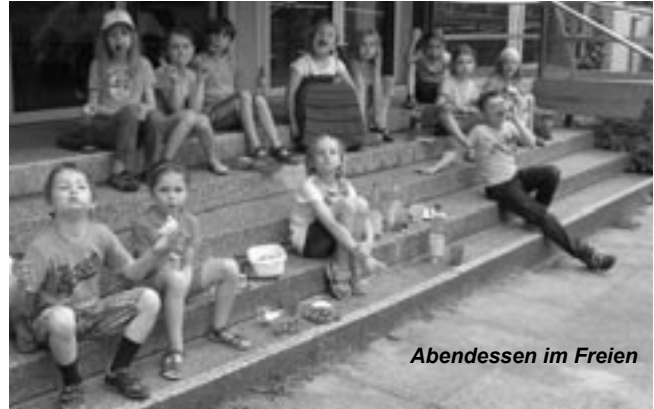
Abendessen im Freien