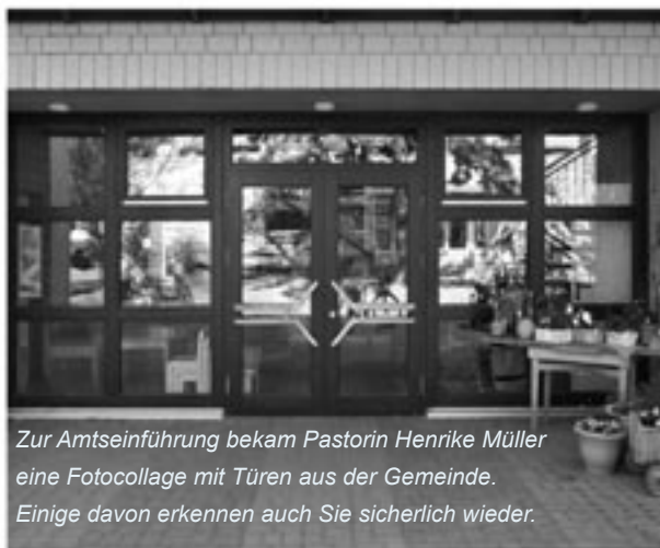
Zur Amtseinführung bekam Pastorin Henrike Müller eine Fotocollage mit Türen aus der Gemeinde. Einige davon erkennen auch Sie sicherlich wieder.